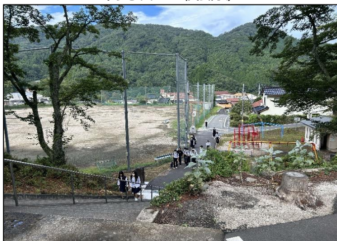
(ある日の登校風景)

「掛高には『本物』がある」を掲げ、地域の皆様からのご支援・ご協力を受けながら掛高が実践してきた「本物の少人数教育」「本物の地域密着」—これらの教育活動を通して獲得した知識や経験は、きっとそれぞれの人生を歩んでいく掛高生の道しるべになるはずです。そして卒業後も掛高が“心のよりどころ”と思ってもらえるような場所でありたいと思っています。