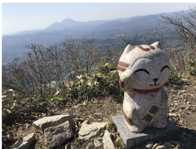
琴引山山頂の様子。 遠方に三瓶山（標高 1,126m）も見えます。